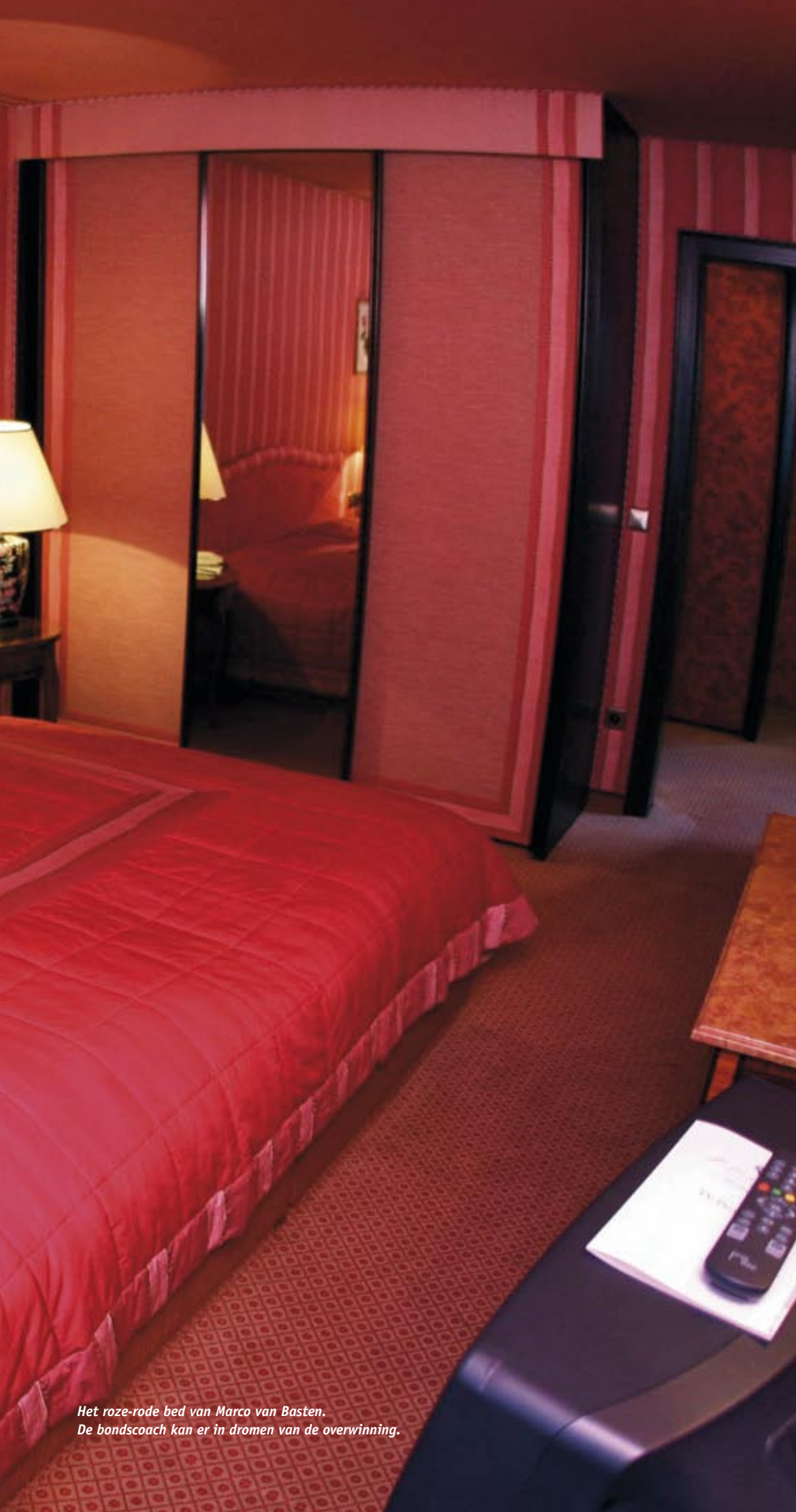
Het roze-rode bed van Marco van Basten. De bondscoach kan er in dromen van de overwinning.